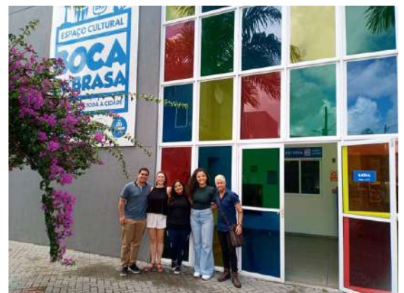
Visite technique des lieux de représentation avec l'équipe de l'ECL et le directeur des Espaces Culturels Boca de Brasa.