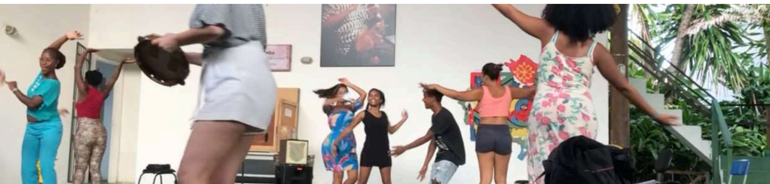
Atelier participatif avec le public lors du lancement du premier volet, le 16 janvier 2023 à l'Espace Culturel de la Fondation Pierre Verger, Salvador de Bahia