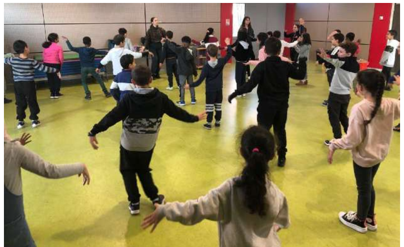
Premier atelier du 12 décembre 2022 à l'École Anatole France A, Gennevilliers