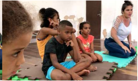
Première intervention des professionnelles du CEDECA-Bahia auprès des jeunes participant à « R-Encontros ».