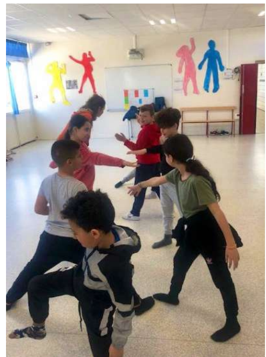
Atelier autour de l'espace qui se trouve autour du corps de l'autre : comment créer des formes avec cet espace sans toucher l'autre.