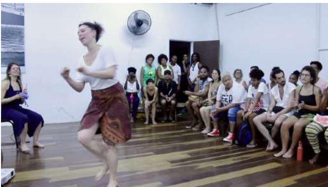
2020 - présentation de la recherche « La Bouche du Monde », dans le cadre de l'évènement Movimentos Trocados