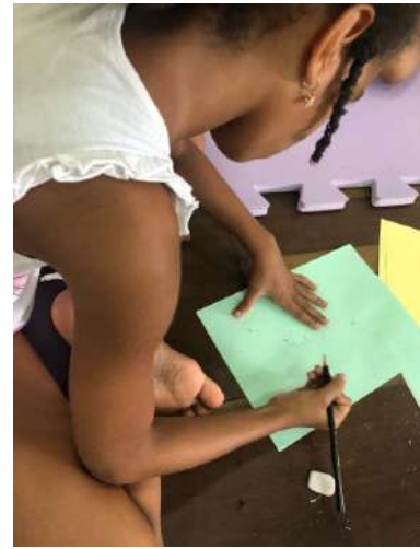
Exercices autour de l'image du corps dans le cadre des ateliers du CEDECA-Bahia