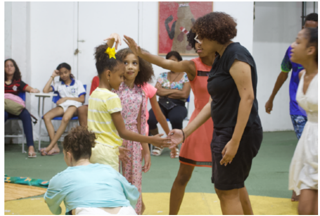
9 février 2023 : restitution publique de « R-Encontros », Espace Cultural de la F. P. Verger.

Affiche d'annonce de la 1e soirée de restitution des jeunes + présentation de la conférence performée de Fanny Vignals. Graphisme ©Alexandre San Goes, Fondation Pierre Verger.