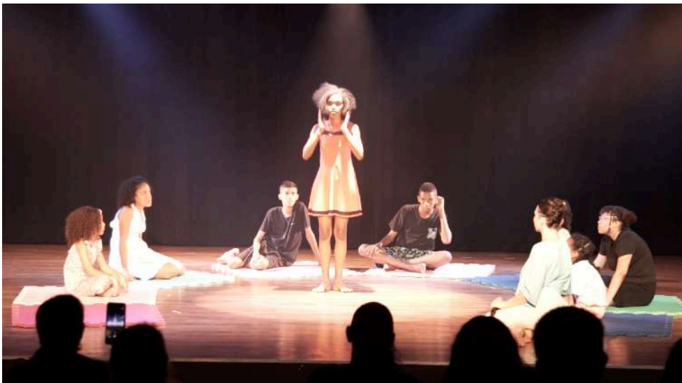
11 février 2023 : restitution publique de « R·Encontros », Espace Culturel Boca de Brasa Cajazeiras, Salvador.