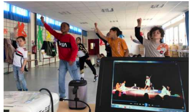
Apprentissage des danses individuelles des enfants et jeunes du Brésil