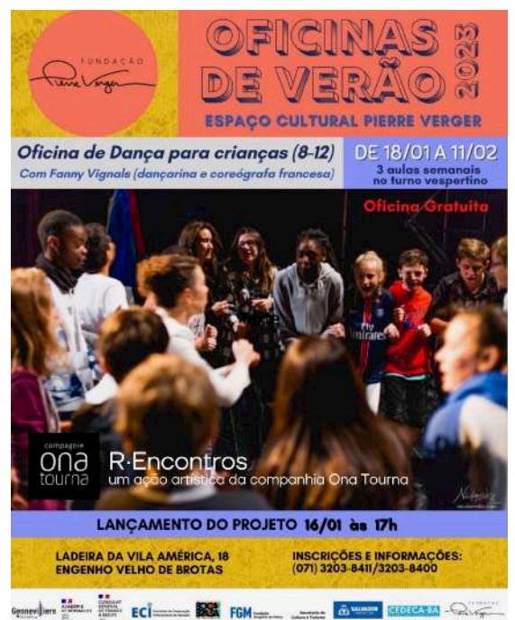
Affiche d'appel à participation au projet. Graphisme ©Alexandre San Goes, Fondation Pierre Verger.