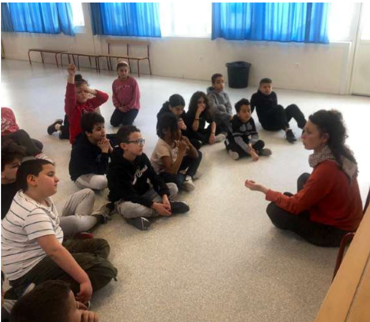
23 mars 2023 : premier atelier à Gennevilliers après de retour du Brésil de la chorégraphe. Échange autour de l'expérience au Brésil.

Affiche d'annonce de la 1e soirée de restitution des jeunes + présentation de la conférence performée de Fanny Vignals. Graphisme ©Alexandre San Goes, Fondation Pierre Verger.